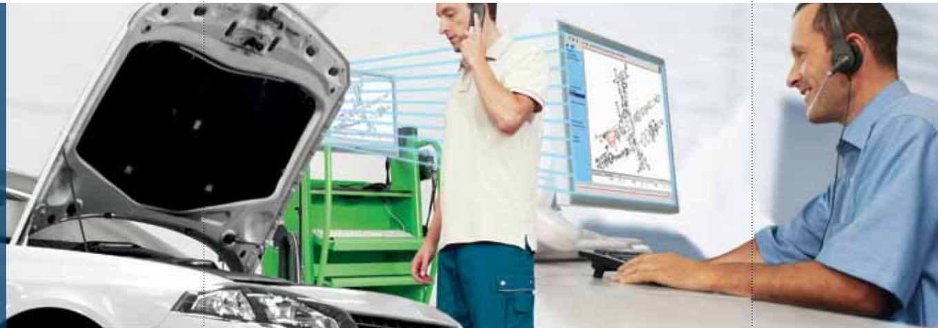
Remote Diagnosis: Der Experte löst Ihre Probleme