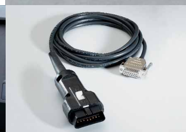
OBD-stekker met aansluitkabel (optie)