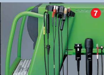
Ergonomisch gevormde sensorhouder