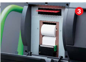
Snelle protocolprinter (< 5 s) en eenvoudige update via diskette