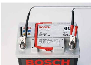
Innovatieve Bosch toerentalmeettechnologie